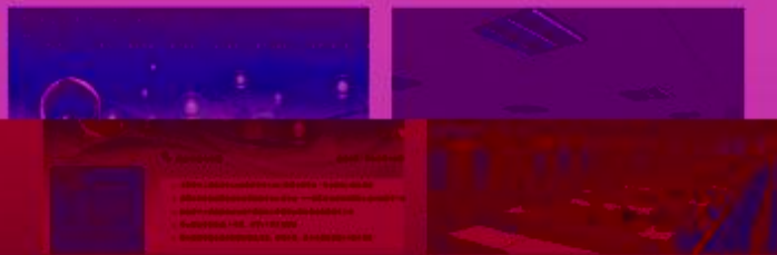
图 5-1-1 工程实践创新项目